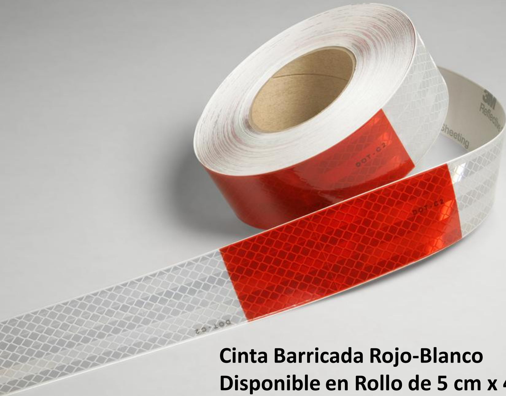
Cinta Barricada Rojo-Blanco Disponible en Rollo de 5 cm x 45.72 m